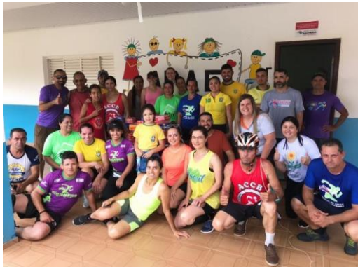
Captação de recursos